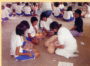
真剣に説明を聞き！

子供達の悲しい事件が多い近年、中学生にとって、この講習は命の大切さに触れる良い機会になったのではないのでしょうか。