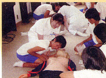
見て、聞いて、感じて……