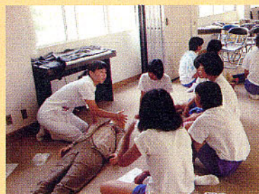
声かけ、救急車の依頼